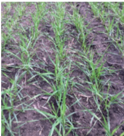
HARISTIDE 2017. november

A hazai kínálatba tartozó fajtákat a mesterseges és szabadföldi körülmények között is tesztelt betegség-ellenállóságra, télállóságra, környezeti alkalmazkodóképességre és számos agronómiai vizsgálatra alapozva választjuk ki. A genetikai értékek megőrzése mellett a magyarországi adottságokhoz igazodó kalászos kínálatunk II. fokú vetőmagszükséglete ma már teljes egészében ellenőrzött, hazai előállításból származik. Örvedetes, hogy az őszi búzáink, Trismart tritikále, JUP őszi árpa mellett a durum búzák iránti kereslet is kiegyenlített. Utóbbi termesztése a szektoron belül az elmúlt években növekvő kereslet hatására magas jövedelemszintet biztosított a termelőknek. Ez indokolta a HARISTIDE durum búza Magyarországi bevezetését is.